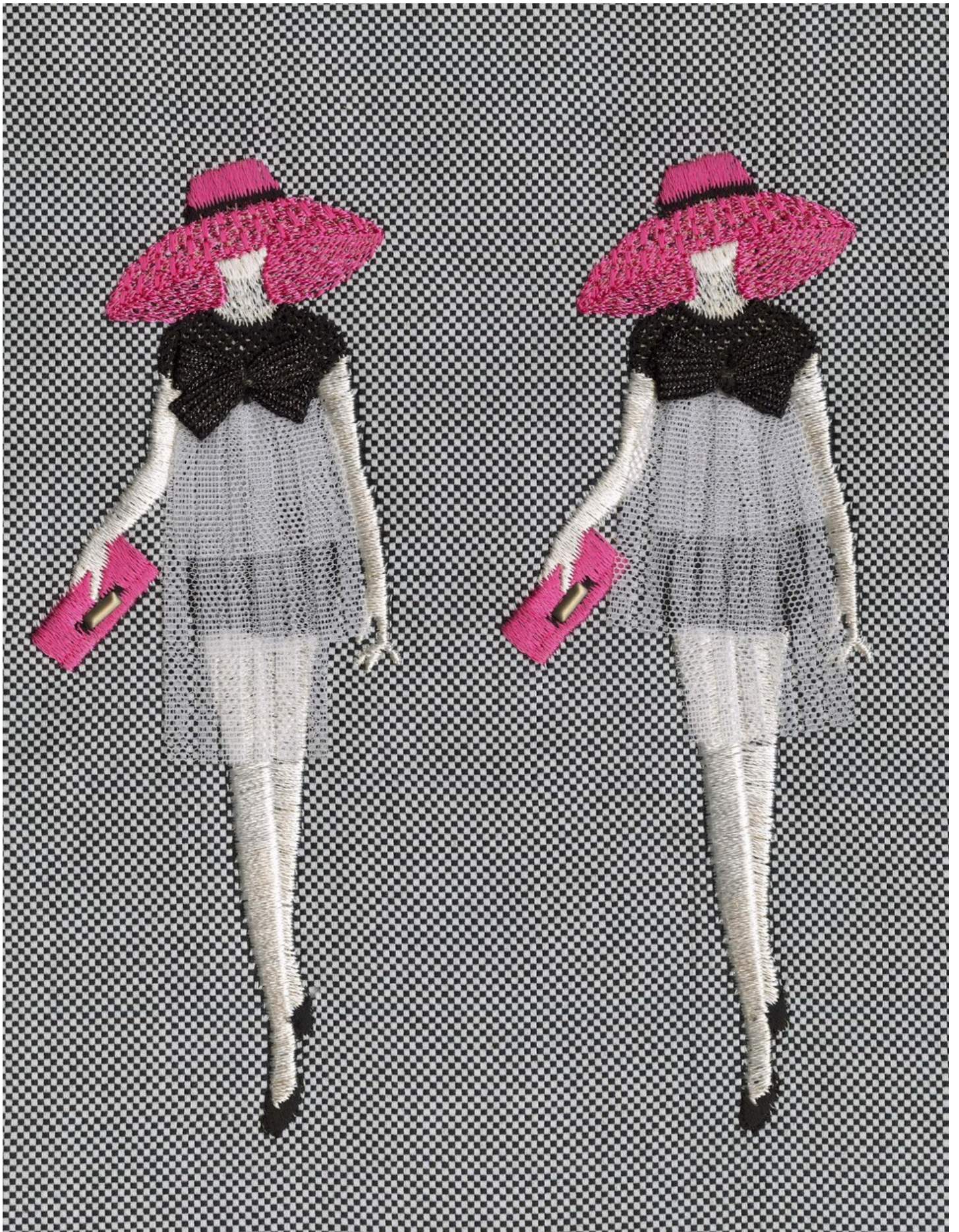
"토비아스 카스파, Personal Shopper (Two Women with Pink Purses and Hats), 2022 © Tobias Kaspar Courtesy the artist and Galerie Peter Kilchmann, Zurich" "Tobias Kaspar Personal Shopper (Two Women with Pink Purses and Hats), 2022 Inkjet print on Hahnemühle Photo Rag Ultra Smooth Paper 130 x 100 cm"