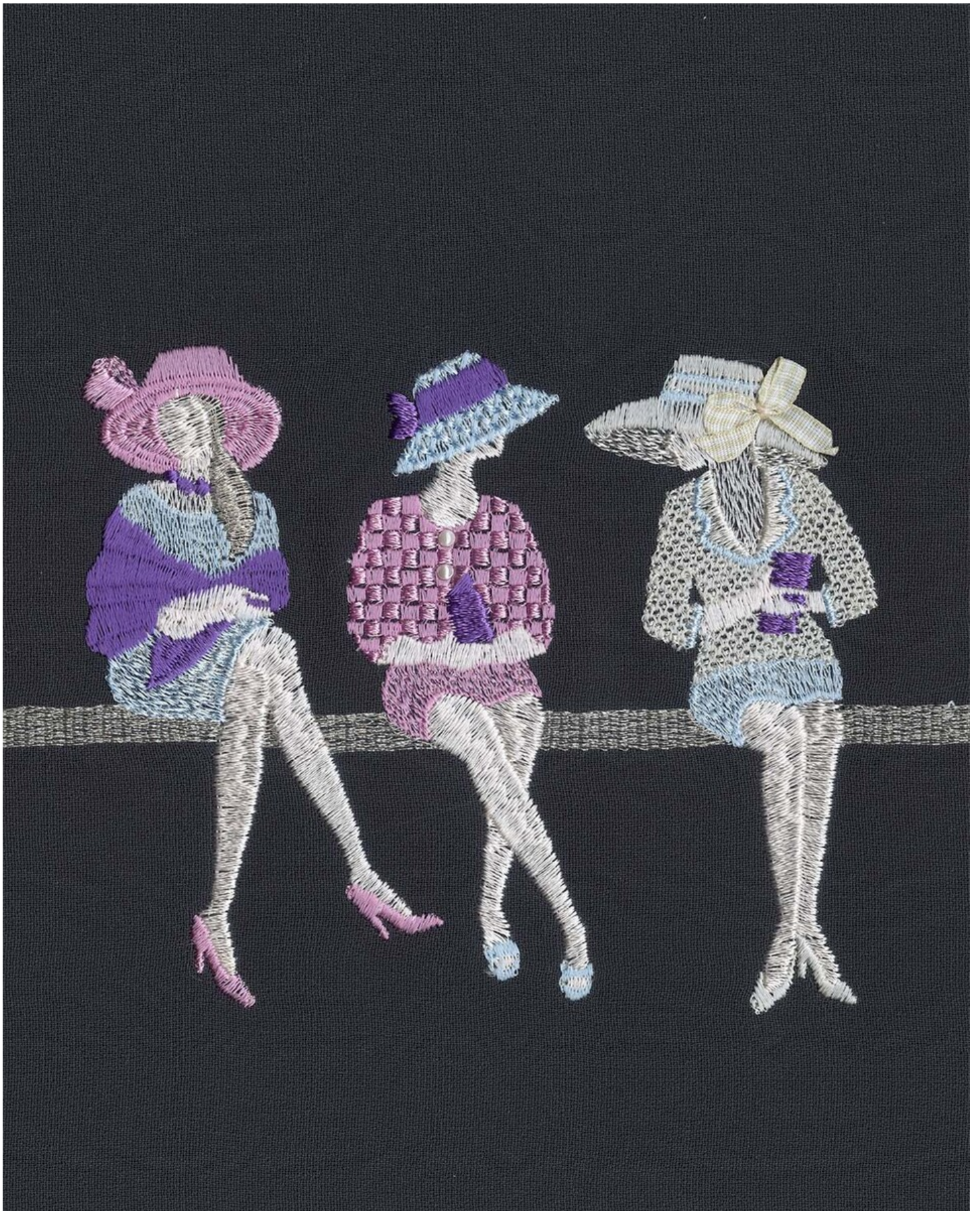
"토비아스 카스파, Conversation Piece, 2022 © Tobias Kaspar Courtesy the artist and Galerie Peter Kilchmann, Zurich" "Tobias Kaspar Conversation Piece, 2022 Inkjet print on Hahnemühle Photo Rag Ultra Smooth Paper 25 x 20 cm"